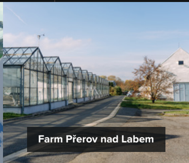
Farm Přešov nad Labem