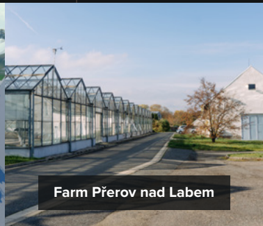
Farm Přešov nad Labem